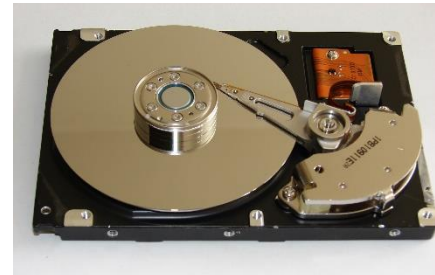
Слика 3.80 Тврди диск

HDD (Hard disk drive) - тврди диск (слика 3.80) је уређај који служи за трајно чување података (и након престанка напајања електричном енергијом). Чине га кружне намагнетисане плоче. Рачунар подацима сачуваним на овој меморији приступа спорије него подацима који се налазе у радној меморији. Меморијски капацитет тврдог диска је много већи од капацитета RAM меморије.