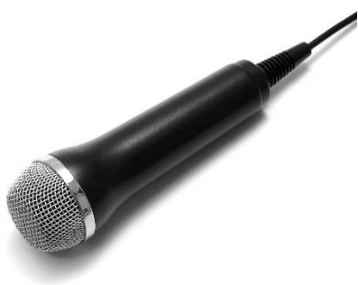
Слика 3.76 Микрофон

Након што процесор обради унете податке, или да бисте уопште могли пратити и бирати команде које задајете рачунару, резултат рада приказује се на излазним јединицама (монитор, звучници, штампач...).