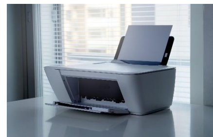
Слика 3.74 Мултифункционални уређај који обједињава скенер, копир и штампач