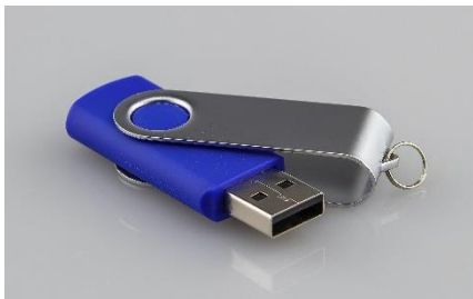
Слика 3.81 Флеш меморија

SSD (Solid State Drive) такође служи за трајно чување података. Нема покретних делова попут хард диска па је време приступа подацима који су на њему сачувани много краће, а рад рачунара самим тим бржи и тиши. Енергетски је ефикаснији од HDD диска истог меморијског капацитета.