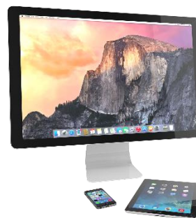
Слика 3.77 Монитор

Излазна јединица која нам омогућава да слику из рачунара пренесемо на папир или неки други материјал је штампач . Постоје различите врсте штампача у зависности од тога коју технику рада