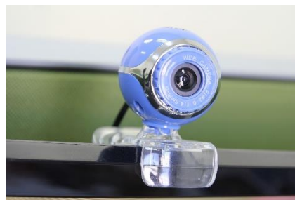
Слика 3.75 Дигитална камера

Поред видео записа могуће је снимати и чувати и аудио записе. Уколико такав запис треба учитати у рачунар, као улазни уређај користиће се микрофон (слика 3.76).