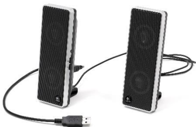
Слика 3.78 Звучници

Резултат обраде звука добијамо путем звучника (слика 3.78) или слушалица као излазних јединица.