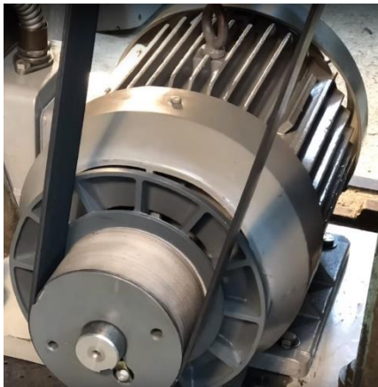
Слика 4.121 Електромотор

Електромотори претварају електричну у механичку енергију. Детаљније ће о овој групи мотора бити речи у осмом разреду.