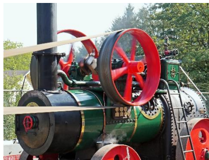
Слика 4.122 Парна машина

Ако прегрејана водена пара покреће клипове топлотног мотора онда је реч о парној машини .