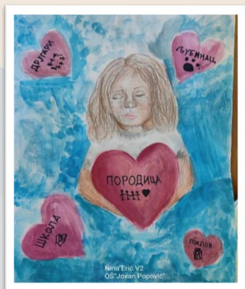
Нина Ерић 5/2 3. награда на школском такмичењу