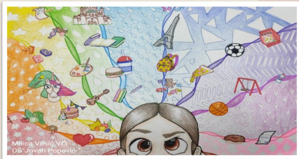
Милица Васић 6/3 1. награда на школском такмичењу