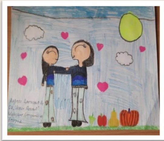
Анђела Цветковић 2/1

1. награда за ликовни рад на општинском такмичењу