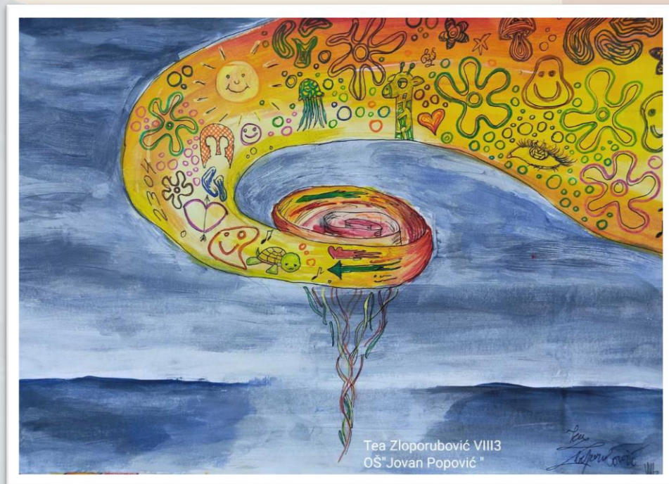
Теа Злопорубовић 8/3

Специјална награда за ликовни израз на општинском такмичењу