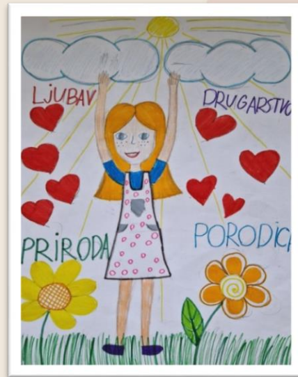
Ана Бјеловук 4/2

1. награда за ликовни рад на општинском такмичењу